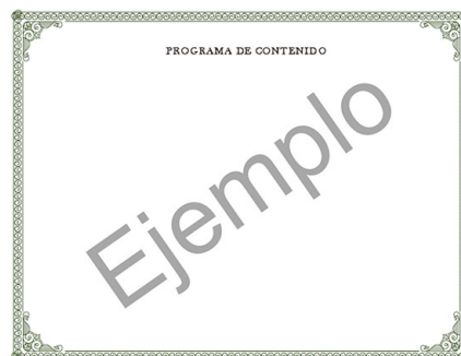
Parte trasera del certificado