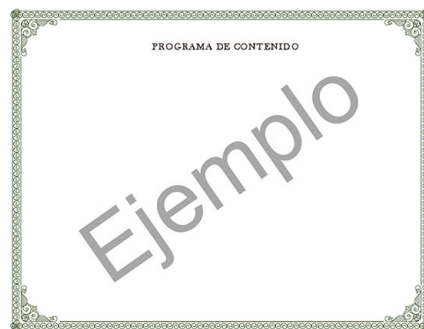
Parte trasera del certificado