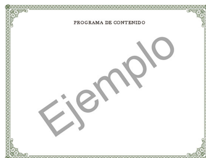
Parte trasera del certificado