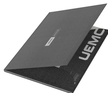
Carpeta del certificado de Máster y expertos universitarios