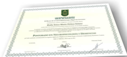
Parte delantera del certificado

Según las bases de la UEMC no se puede mostrar el certificado que los alumnos recibirían al realizar las formaciones, este sería a modo de ejemplo :