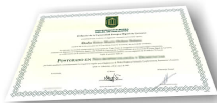
Parte delantera del diploma de un máster o experto

Los alumnos recibirían, al realizar las formaciones, un diploma como el del ejemplo: