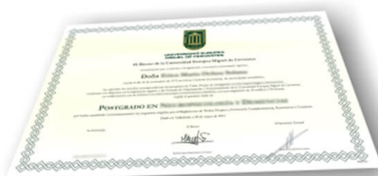
Parte delantera del diploma de un máster o experto

Los alumnos recibirían, al realizar las formaciones, un diploma como el del ejemplo: