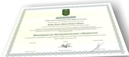
Parte delantera del diploma de un máster o experto

Los alumnos recibirían, al realizar las formaciones, un diploma como el del ejemplo: