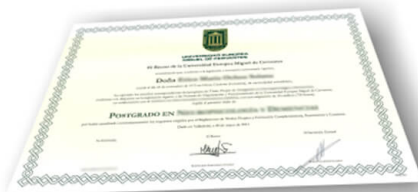
Parte delantera del diploma de un máster o experto

Los alumnos recibirían, al realizar las formaciones, un diploma como el del ejemplo: