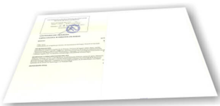
Parte trasera del diploma de un máster o experto