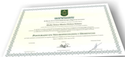
Parte delantera del diploma de un máster o experto

Los alumnos recibirían, al realizar las formaciones, un diploma como el del ejemplo: