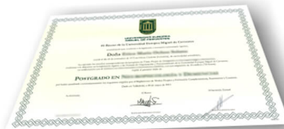
Parte delantera del diploma de un máster o experto

Los alumnos recibirían, al realizar las formaciones, un diploma como el del ejemplo: