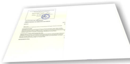
Parte trasera del diploma de un máster o experto