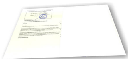
Parte trasera del diploma de un máster o experto