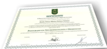
Parte delantera del diploma de un máster o experto

Los alumnos recibirían, al realizar las formaciones, un diploma como el del ejemplo: