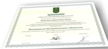
Parte delantera del diploma de un máster o experto

Los alumnos recibirían, al realizar las formaciones, un diploma como el del ejemplo: