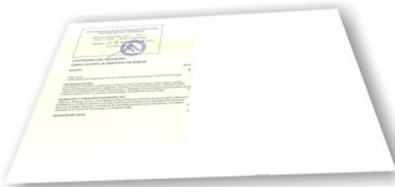
Parte trasera del diploma de un máster o experto