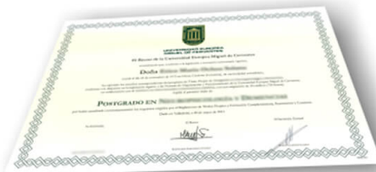
Parte delantera del diploma de un máster o experto

Los alumnos recibirían, al realizar las formaciones, un diploma como el del ejemplo: