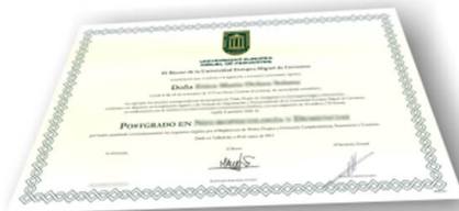
Parte delantera del diploma de un máster o experto

Los alumnos recibirían, al realizar las formaciones, un diploma como el del ejemplo: