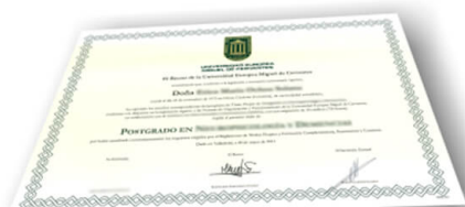
Parte delantera del diploma de un máster o experto

Los alumnos recibirían, al realizar las formaciones, un diploma como el del ejemplo: