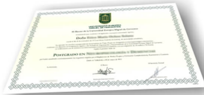
Parte delantera del diploma de un máster o experto

Los alumnos recibirían, al realizar las formaciones, un diploma como el del ejemplo: