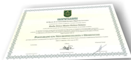
Parte delantera del diploma de un máster o experto

Los alumnos recibirían, al realizar las formaciones, un diploma como el del ejemplo: