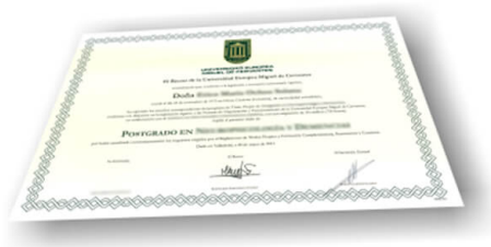
Parte delantera del diploma de un máster o experto

Los alumnos recibirían, al realizar las formaciones, un diploma como el del ejemplo: