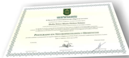
Parte delantera del diploma de un máster o experto

Los alumnos recibirían, al realizar las formaciones, un diploma como el del ejemplo: