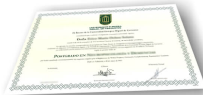
Parte delantera del diploma de un máster o experto

Los alumnos recibirían, al realizar las formaciones, un diploma como el del ejemplo: