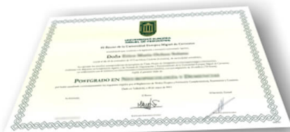
Parte delantera del diploma de un máster o experto

Los alumnos recibirían, al realizar las formaciones, un diploma como el del ejemplo: