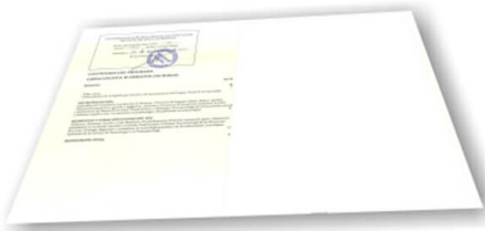
Parte trasera del diploma de un máster o experto