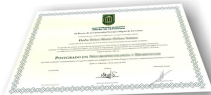
Parte delantera del diploma de un máster o experto

Los alumnos recibirían, al realizar las formaciones, un diploma como el del ejemplo: