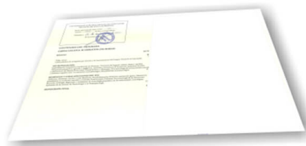
Parte trasera del diploma de un máster o experto