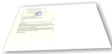
Parte trasera del diploma de un máster o experto