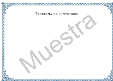
Parte trasera del diploma