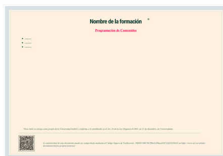
Parte trasera del diploma