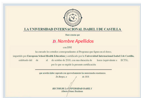
Parte delantera del diploma

Todos los alumnos que realicen un máster, especialista, experto, certificado o diploma online recibirán un diploma expedido por la Universidad Isabel I . El diploma es emitido únicamente por la universidad certificadora ( Universidad Isabel I ) de las actividades formativas ( Ley 44/2003 de Ordenación de las Profesiones Sanitarias. Art. 35.1. Consulte el baremo de su Comunidad Autónoma ).