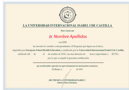
Parte delantera del diploma

Todos los alumnos que realicen un máster, especialista, experto, certificado o diploma online recibirán un diploma expedido por la Universidad Isabel I . El diploma es emitido únicamente por la universidad certificadora ( Universidad Isabel I ) de las actividades formativas ( Ley 44/2003 de Ordenación de las Profesiones Sanitarias. Art. 35.1. Consulte el baremo de su Comunidad Autónoma ).