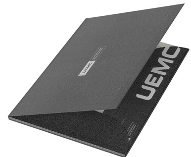
Carpeta del certificado de Máster y expertos universitarios