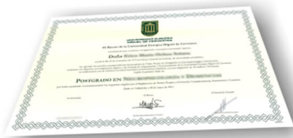
Parte delantera del certificado

Según las bases de la UEMC no se puede mostrar el certificado que los alumnos recibirían al realizar las formaciones, este sería a modo de ejemplo :