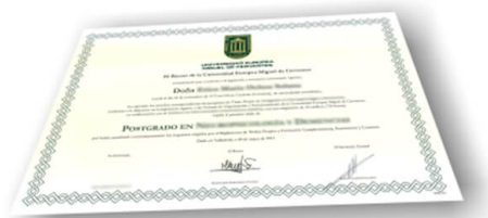
Parte delantera del diploma de un máster o experto

Los alumnos recibirían, al realizar las formaciones, un diploma como el del ejemplo: