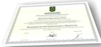
Parte delantera del diploma de un máster o experto

Los alumnos recibirían, al realizar las formaciones, un diploma como el del ejemplo: