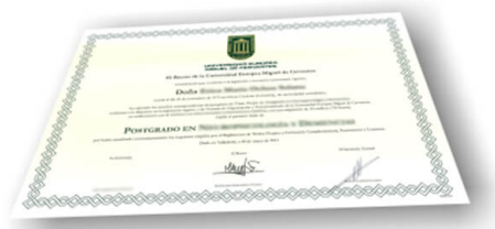
Parte delantera del certificado

Los alumnos recibirían, al realizar las formaciones, un diploma como el del ejemplo :