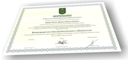
Parte delantera del certificado

Los alumnos recibirían, al realizar las formaciones, un diploma como el del ejemplo :