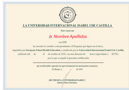
Parte delantera del certificado

Todos los alumnos que realicen un máster, especialista, experto, certificado o diploma online recibirán un certificado expedido por la Universidad Isabel I . El certificado es emitido únicamente por la universidad certificadora ( Universidad Isabel I ) de las actividades formativas ( Ley 44/2003 de Ordenación de las Profesiones Sanitarias. Art. 35.1. Consulte el baremo de su Comunidad Autónoma ).