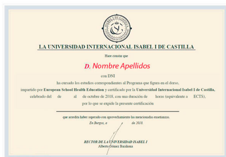
Parte delantera del certificado

Todos los alumnos que realicen un máster, especialista, experto, certificado o diploma online recibirán un certificado expedido por la Universidad Isabel I . El certificado es emitido únicamente por la universidad certificadora ( Universidad Isabel I ) de las actividades formativas ( Ley 44/2003 de Ordenación de las Profesiones Sanitarias. Art. 35.1. Consulte el baremo de su Comunidad Autónoma ).