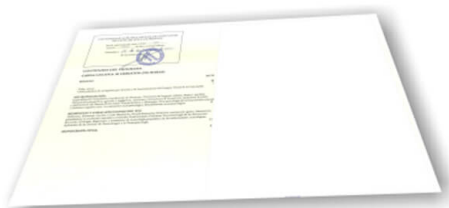
Parte trasera del certificado