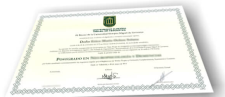
Parte delantera del certificado

Los alumnos recibirían, al realizar las formaciones, un diploma como el del ejemplo :